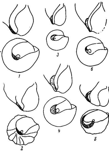
Рис. 2. Низ последнего оборота раковины со стороны устья (вверху) и с базальной стороны (внизу): 1 — Melanopsis (Melanopsis) maroccana , 2 — M. (Parreysiana) parreysi , 3 — M. (Mingrelliciana) buccinoidea , 4 — M. (Canthidomus) turkmenica , 5 — M. (Nudosiana) mesopotamica , 6 — M. (Sistaniana) sistanica